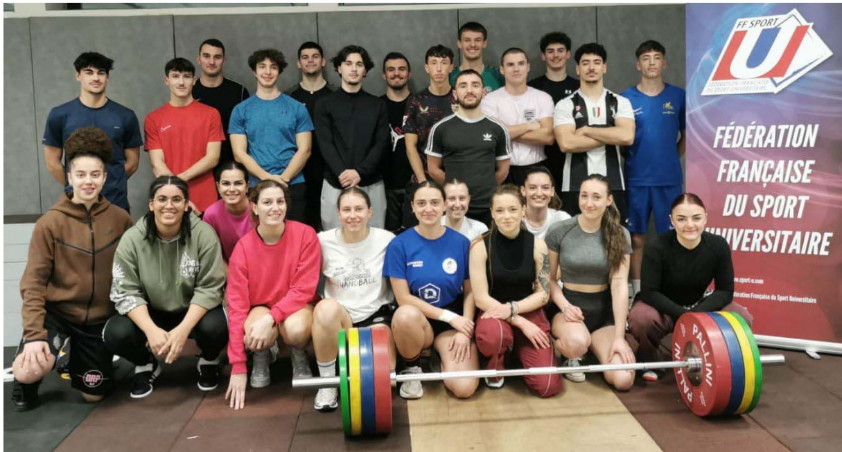
Championnat d'académie à Limoges le 20/01/2025 : les participant(e)s